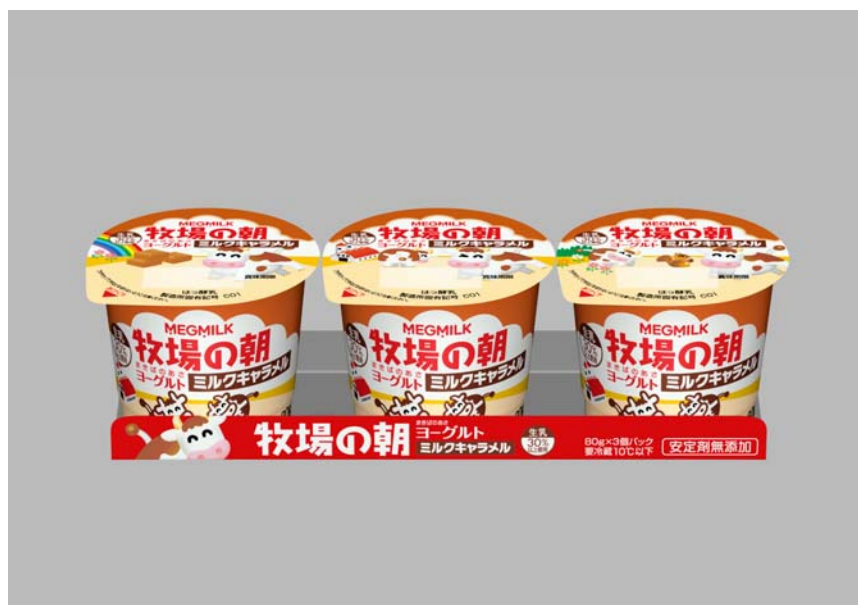
『牧場の朝ヨーグルト ミルクキャラメル』（80g×3）

従来からの『牧場の朝ヨーグルト 生乳仕立て』『同 いちご』は容量・デザイン変更、『牧場の朝のむヨーグルト』はパッケージデザイン変更を施し、それぞれ同時にリニューアル発売します。