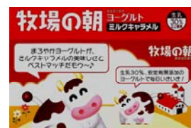
「牧場の朝ヨーグルト ミルクキャラメル」 台紙中央部分